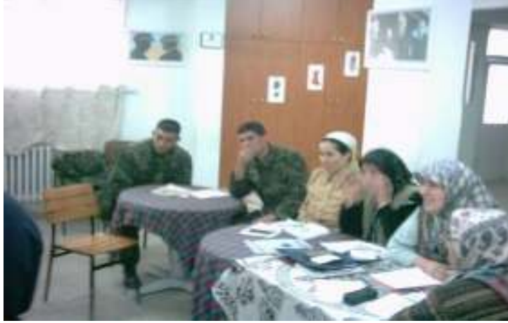
OKUMA - YAZMA KURSLARI