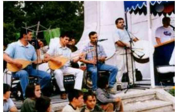
TÜRK HALK MÜZİĐİ KURSU

2006 İL BİRİNCİSİ / GRUP BİRİNCİSİ 2005 İL BİRİNCİSİ / GRUP ÜÇÜNCÜSÜ