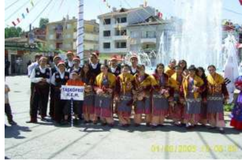
Sarımsak ve Kültür Festivali 2005