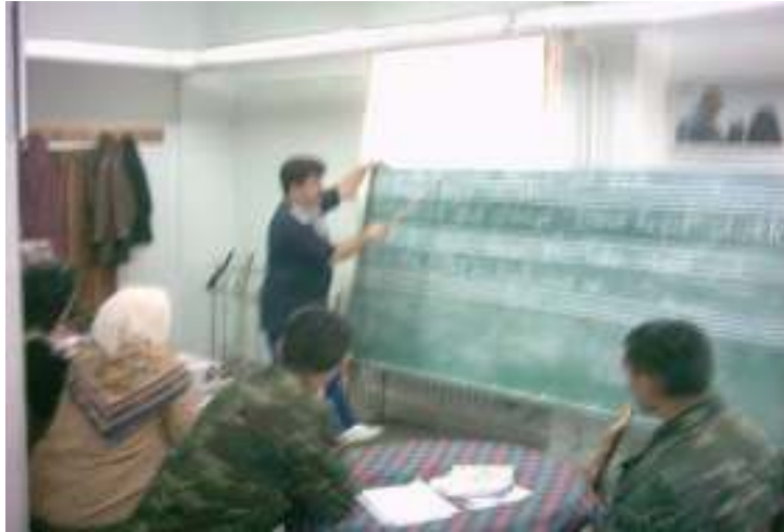
ANNE-ÇOCUK EĞİTİMİ KURSU